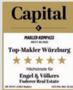
Sandra Fuderer Gesellschafterin

Möchten Sie wissen, welches Potenzial Ihre Immobilie hat? Mittels QR-Code oder unter www.immo-online-bewerten.de erhalten Sie schnell und präzise eine kostenlose Ersteinschätzung.